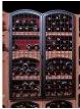
Kovaná železná mříž velká Bloc Cellier