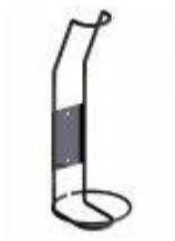
Držák lahví Bloc Cellier

K regálovému systému je možné přibjednat další příslušenství: