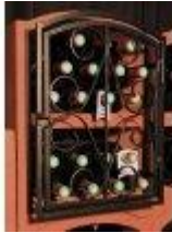
Mříž Standard Bloc Cellier