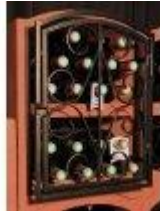
Mříž Standard Bloc Cellier