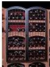
Kovaná železná mříž velká Bloc Cellier