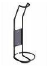
Držák lahví Bloc Cellier

K regálovému systému je možné přibjednat další příslušenství: