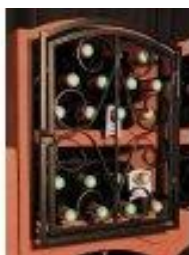
Mříž Standard Bloc Cellier