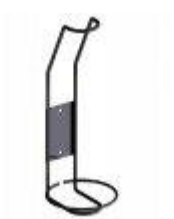
Držák lahví Bloc Cellier

K regálovému systému je možné přibjednat další příslušenství: