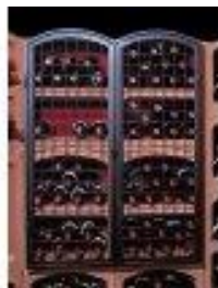
Kovaná železná mříž velká Bloc Cellier