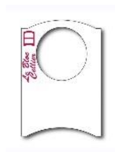
Visačky na lahve (plastové)