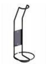
Držák lahví Bloc Cellier

K regálovému systému je možné přibjednat další příslušenství: