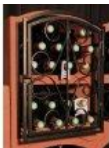
Mříž Standard Bloc Cellier