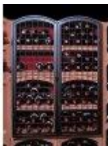
Kovaná železná mříž velká Bloc Cellier